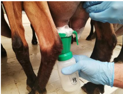
Fig. 3. Pulizia dei capezzoli mediante pre-dipping

L'eliminazione dei primi getti di latte (Fig. 2), pur non essendo fondamentale ai fini della stimolazione della ghiandola mammaria nella specie caprina, rappresenta sicuramente una pratica raccomandabile, in quanto consente di eliminare il latte caratterizzato dalla carica batterica più elevata , ossia quello presente nel dotto del capezzolo. Inoltre questa fase è obbligatoria per legge, perché permette di valutare visivamente eventuali anomalie del latte , come la presenza di sangue o di coaguli. Questa operazione non comporta eccessive perdite di tempo e consente anche di valutare lo stato generale della mammella. I primi getti vanno raccolti in un contenitore a fondo scuro e non devono mai essere gettati a terra, dove potrebbero trasformarsi in un veicolo di diffusione di patogeni nell'ambiente (per esempio tramite le zampe di cani e gatti o il pestaggio dell'operatore stesso).