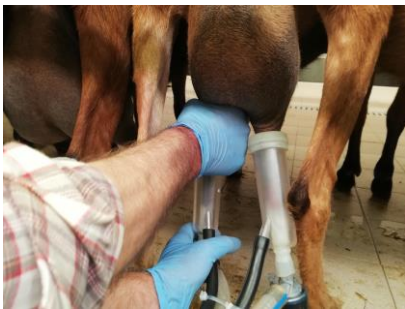
Fig. 4. Attacco del gruppo di mungitura

Il pre-dipping (Fig. 3.) consiste nella deterzione dei capezzoli con un prodotto specifico e autorizzato, per eliminare lo sporco presente. Se questa operazione viene effettuata, deve necessariamente essere seguita dall'asciugatura dei capezzoli, in modo che l'eventuale sporcizia presente sulla cute non venga convogliata in prossimità dell'orifizio del capezzolo, con conseguente aumento del rischio di infezioni a carico della mammella. Il pre-dipping può essere effettuato con salviette imbibite, alcune delle quali contengono prodotti che evaporano (in questi casi non è quindi necessaria l'asciugatura). Questa operazione concorre nella riduzione della carica batterica della cute dei capezzoli e del latte , con conseguente diminuzione del tasso di nuove infezioni intramammarie. In alternativa al pre-dipping, se i capezzoli sono già abbastanza puliti (per esempio quando le capre sono allevate su lettiera asciutta senza feci affioranti), si può utilizzare una salviettina monouso per la pulizia a secco o della carta a perdere.