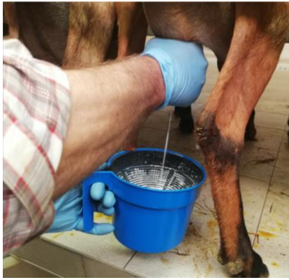
Fig. 2. Eliminazione dei primi getti di latte

L'eliminazione dei primi getti di latte (Fig. 2), pur non essendo fondamentale ai fini della stimolazione della ghiandola mammaria nella specie caprina, rappresenta sicuramente una pratica raccomandabile, in quanto consente di eliminare il latte caratterizzato dalla carica batterica più elevata , ossia quello presente nel dotto del capezzolo. Inoltre questa fase è obbligatoria per legge, perché permette di valutare visivamente eventuali anomalie del latte , come la presenza di sangue o di coaguli. Questa operazione non comporta eccessive perdite di tempo e consente anche di valutare lo stato generale della mammella. I primi getti vanno raccolti in un contenitore a fondo scuro e non devono mai essere gettati a terra, dove potrebbero trasformarsi in un veicolo di diffusione di patogeni nell'ambiente (per esempio tramite le zampe di cani e gatti o il pestaggio dell'operatore stesso).